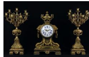
Garniture de Cheminée Epoque Louis XVI