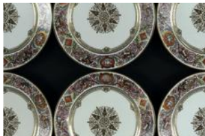
6 assiettes Sèvres Fontainebleau