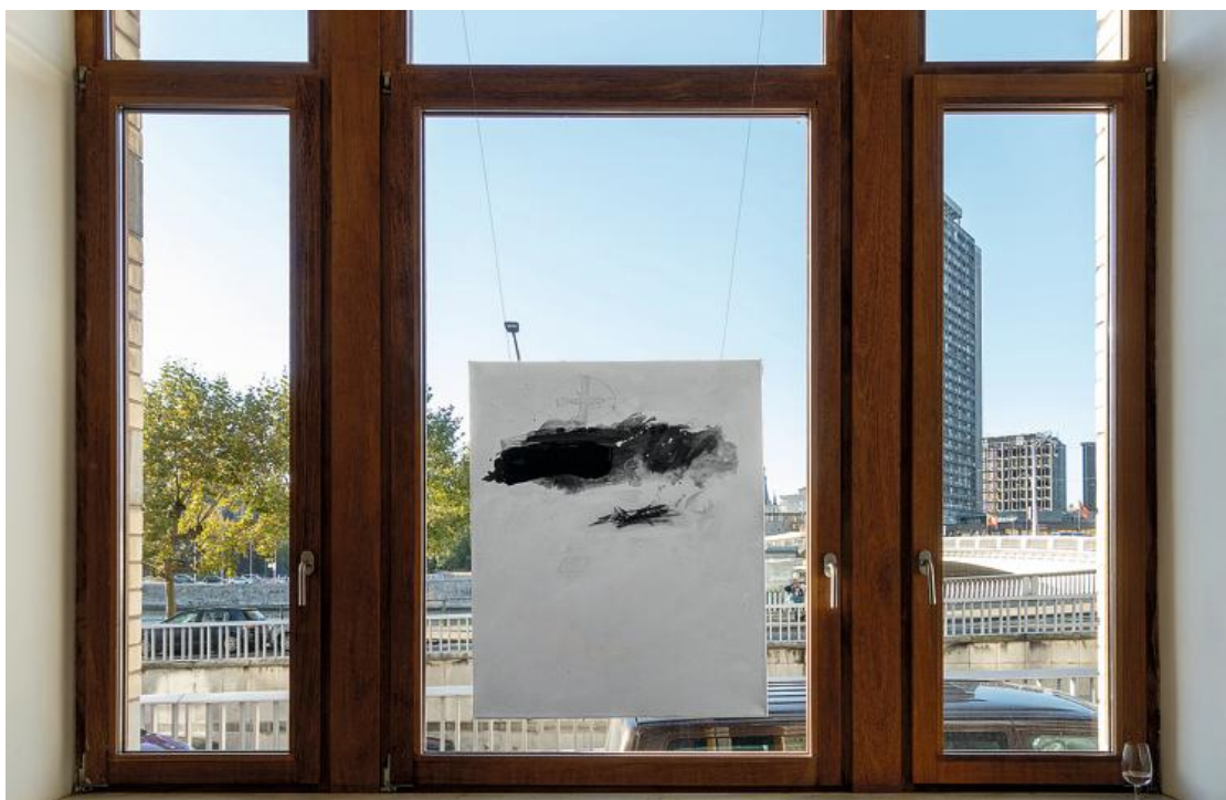
Gabriel Belgeonne, "Surligné", 2020.